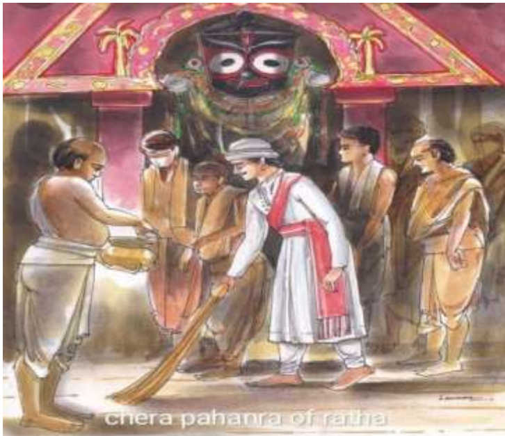
chera paharra of rathia