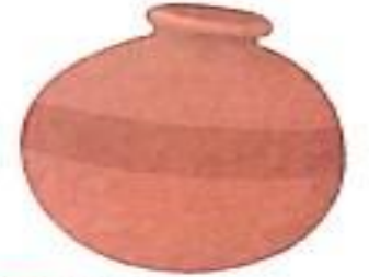
घड़ा (ghada) Earthen water-pot

घ घ घ घ घ घ घ घ घ घ घ घ घ घ घ घ घ घ घ घ घ घ घ घ