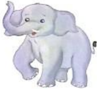
गज (gaj) Elephant