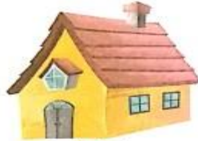
घर (ghar) Home