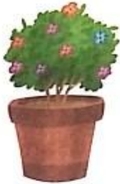
गमला (gamlaa) Flower pot