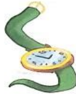
घड़ी (ghadi) Watch