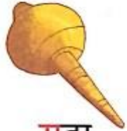
गदा (gadaa) Mace

ग ग ग ग ग ग ग ग ग ग ग ग ग ग ग ग ग ग ग ग ग ग ग ग