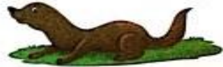
ऊदबिलाव (oodbilaav) Otter