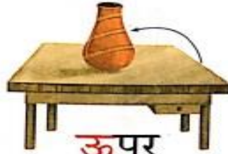
ऊपर (ooper) Up