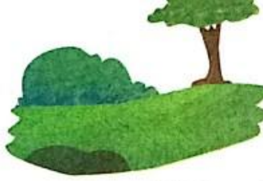
धरती (i) Earth