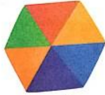
षट्कोण (shatkon) Hexagon