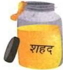
शहद (shahad) Honey