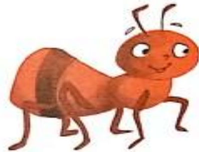
षट्पाद (चींटी) (shatpaad) Ant