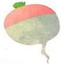
शलगम (shalgam) Turnip