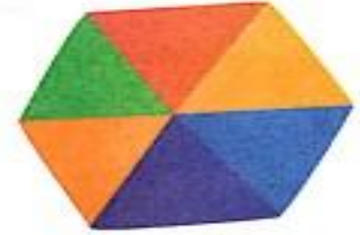
षट्कोण (shatkon) Hexagon

Handwriting practice lines for the letter 'ष' (shat). Each line contains six instances of the letter, with the first one being larger and more prominent for tracing.