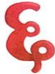
षट् (shat) Six