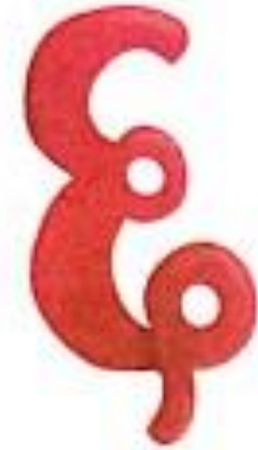
षट् (shat) Six