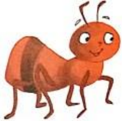
षट्पाद (चींटी) (shatpaad) Ant