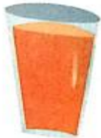
शरबत (sharbat) Squa

Handwriting practice lines for the letter 'श' (sha). Each line contains six instances of the letter, with the first one being larger and more prominent for tracing.