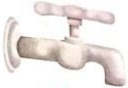
नल (nal) Tap