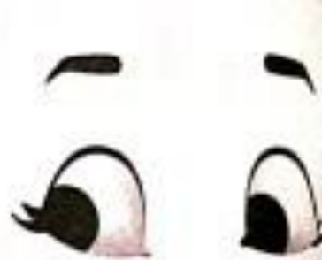
नयन (nayan) Eyes