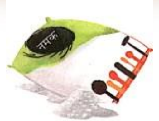
नमक (namak) Salt