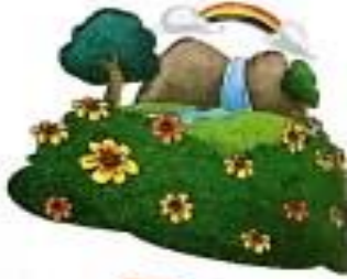
उपवन (upvan) Garden