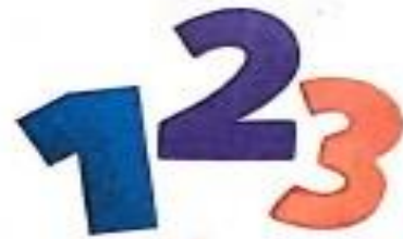
अंक (ank) Digit