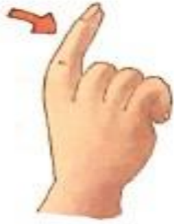
अंगुली (anguli) Finger