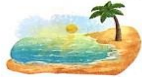
प्रातः (pratah) Morning