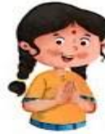
नमः (namah) Namah