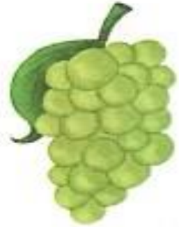
अंगूर (angoor) Grapes