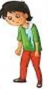
शनैः-शनैः (shaneh-shaneh) Slowly-Slowly