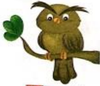
उल्लू (ulloo) Owl