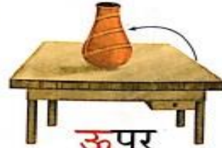
ऊपर (ooper) Up