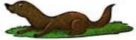
ऊदबिलाव (oodbilaav) Otter