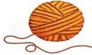
ऊन (oon) Wool