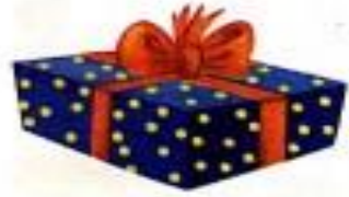
उपहार (uphaar) Gift