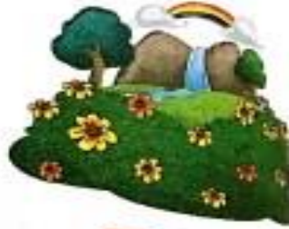
उपवन (upvan) Garden