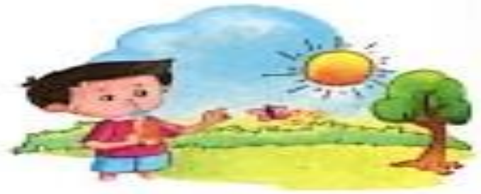
ऋतु ( ritu ) Season