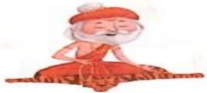
ऋषि ( rishi ) Sage