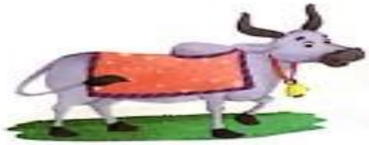
ऋषभ ( rishabh ) Ox