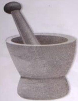
ओखली (okhalee) Mortar