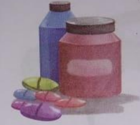
औषधि (aushadhi) Medicine