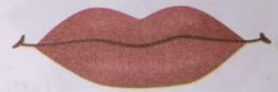
ओठ (oth) Lips