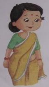
औरत (aurat) Woman