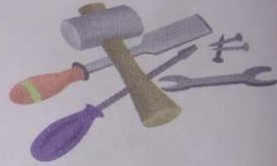
औज़ार (auzaar) Tools