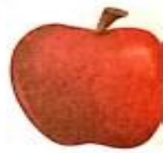
सेब (seb) Apple