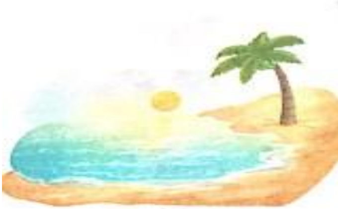
सवेरा (savera) Morning