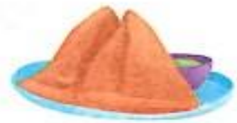
समोसा (samosa) Samosa