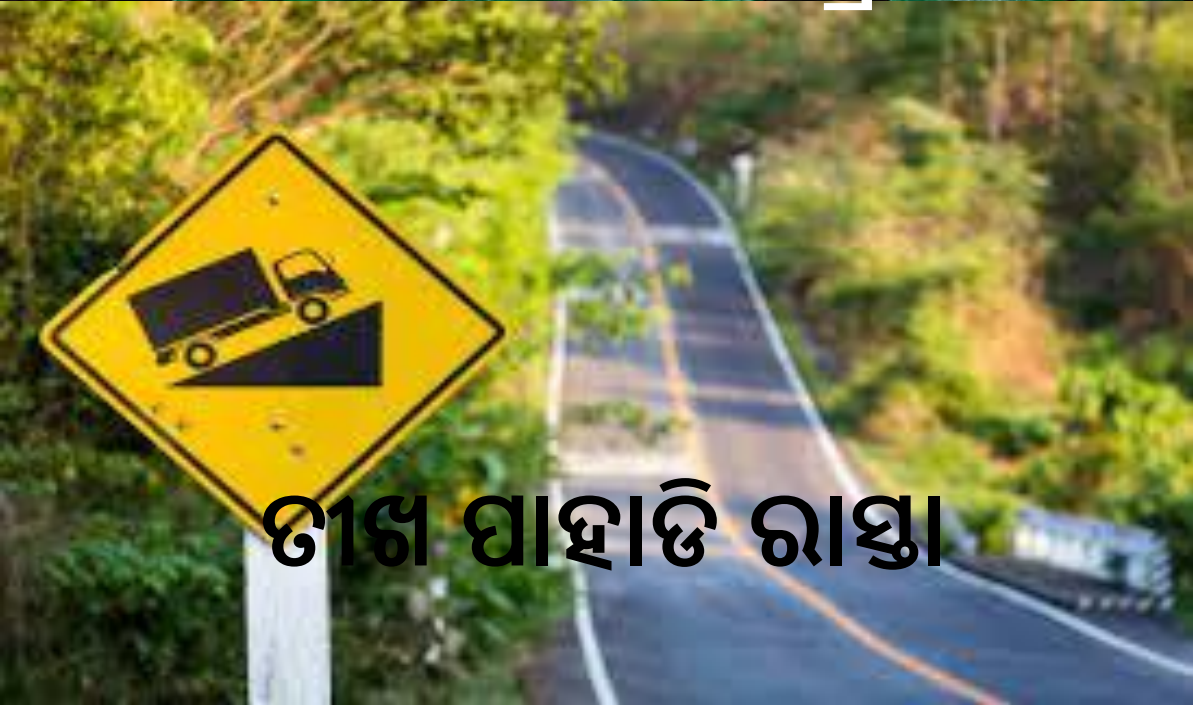
ଟୀକା ପାହାଡ଼ି ରାସ୍ତା