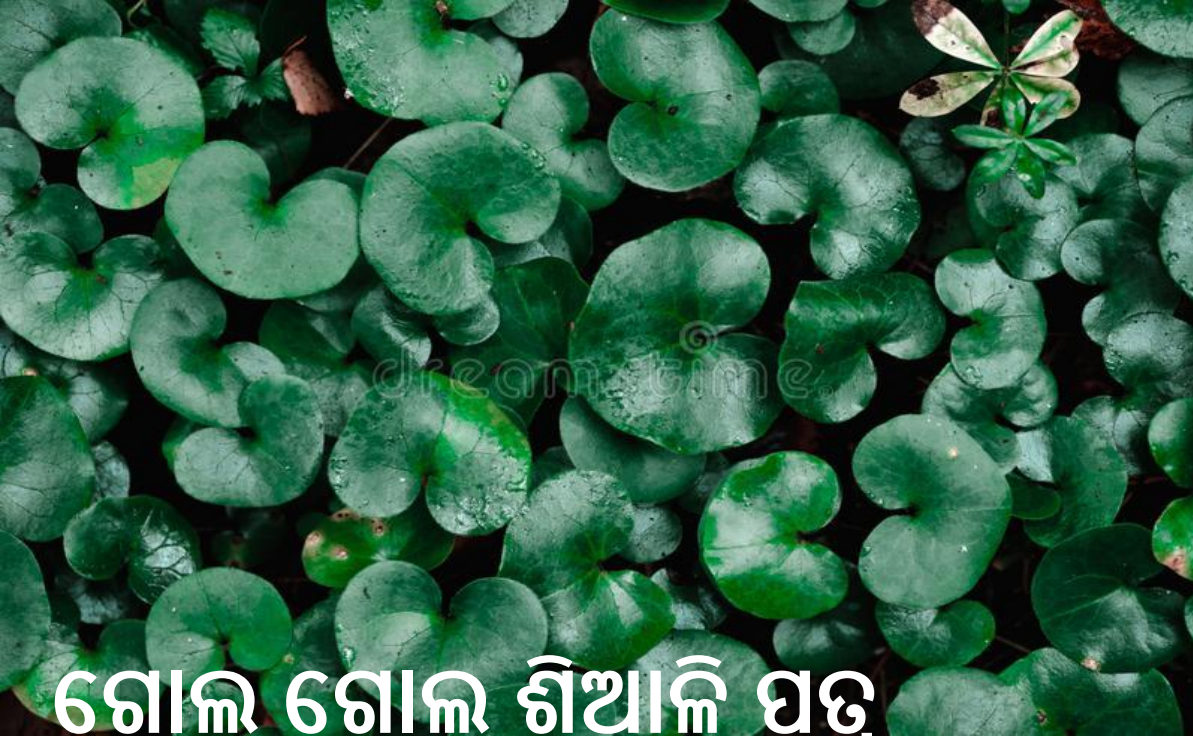
ଗୋଲ ଗୋଲ ଶିଆଳି ପତ୍ର