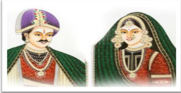
ରାଜା ରାଣୀ ଗପ

ସାରକଥା - ଆଜ୍ଞା ! ପିଲାମାନେ ତୁମେ ମାନେ ବର୍ତ୍ତମାନ ପଞ୍ଚମ ଶ୍ରେଣୀର ଛାତ୍ର ଓ ଛାତ୍ରୀ ଛୋଟ ବେଳୁ ଏବେ ପଠ୍ୟକ୍ରମ ତୁମେ ମାନେ କେତେ କ'ଣ ଗପ ଶୁଣିଥିବ ରାଜାରାଣୀ, ପରି ରାଜଜ , ବୁଢ଼ୀ ଅସୁରୀଣୀ ଏମିତି ଅନେକ କିଛି । କହିଲ ଦେଖୁ ତୁମେ ପିମ୍ପୁଡ଼ି ଓ ଚଢ଼େଇ ଗପ ଶୁଣିଛ ? ଯେଉଁଠି ପିମ୍ପୁଡ଼ିର ଅସମୟରେ ଚଢ଼େଇ ତାକୁ ସାହାଯ୍ୟ କଲା ଓ ଚଢ଼େଇର ଅସମୟରେ ପିମ୍ପୁଡ଼ି ତାର ଉପକାର କଲା । ସତରେ ପିଲାମାନେ ଉପକାର କଲେ କେତେ ଯେ ଖୁସି ଲାଗେ ତୁମେ ମାନେ ନିଶ୍ଚୟ ବୁଝୁଥିବ ଉପକାର ଯଦି ଆମେ କରିବା, ଦୁଃଖ, ଦରିଦ୍ର ମାନଙ୍କୁ ସାହାଯ୍ୟ କରିବା ତେବେ ଭଗବାନ ଆମ ଉପରେ କୃପା କରିବେ ।