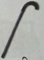
छड़ी (chhadee) Stick

छ छ छ छ छ छ छ छ छ छ छ छ छ छ छ छ छ छ छ छ छ छ छ छ