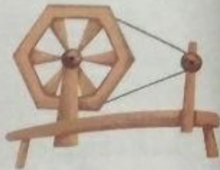
चरखा (charkha) Spinning wheel

च च च च च च च च च च च च च च च च च च च च च च च च