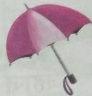
छतरी (chhattree) Umbrella