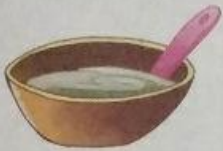
चटनी (chatani) Sauce