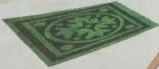
चटाई (chataai) Mat