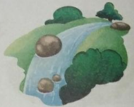
ढलान ( dhalaan ) Steepness