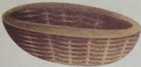
डलिया (dalia) Basket