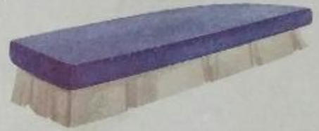
डस्टर (daster) Duster