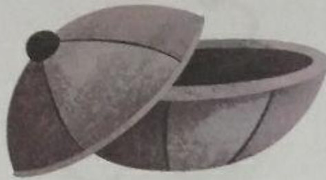
ढक्कन ( dhakkan ) Lid