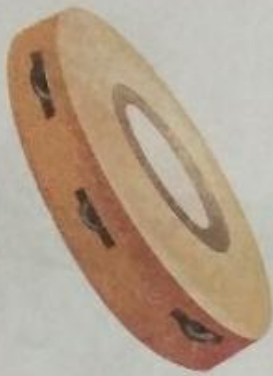
ढपली ( dhaplee ) Tambourine