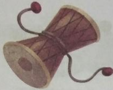
डमरू (Damroo) Small drum