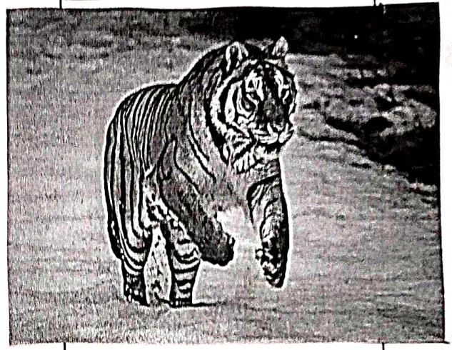
भारत का राष्ट्रीय पशु-बाघ