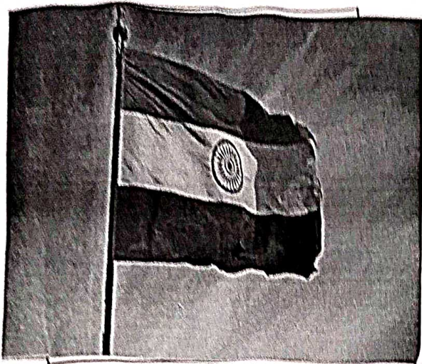
भारत का ध्वज-तिरंगा