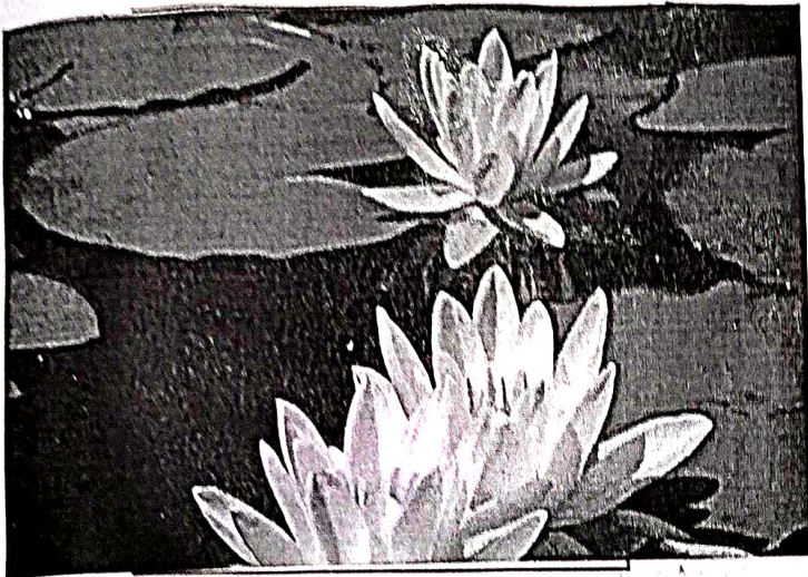
भारत का राष्ट्रीय फूल-कमल