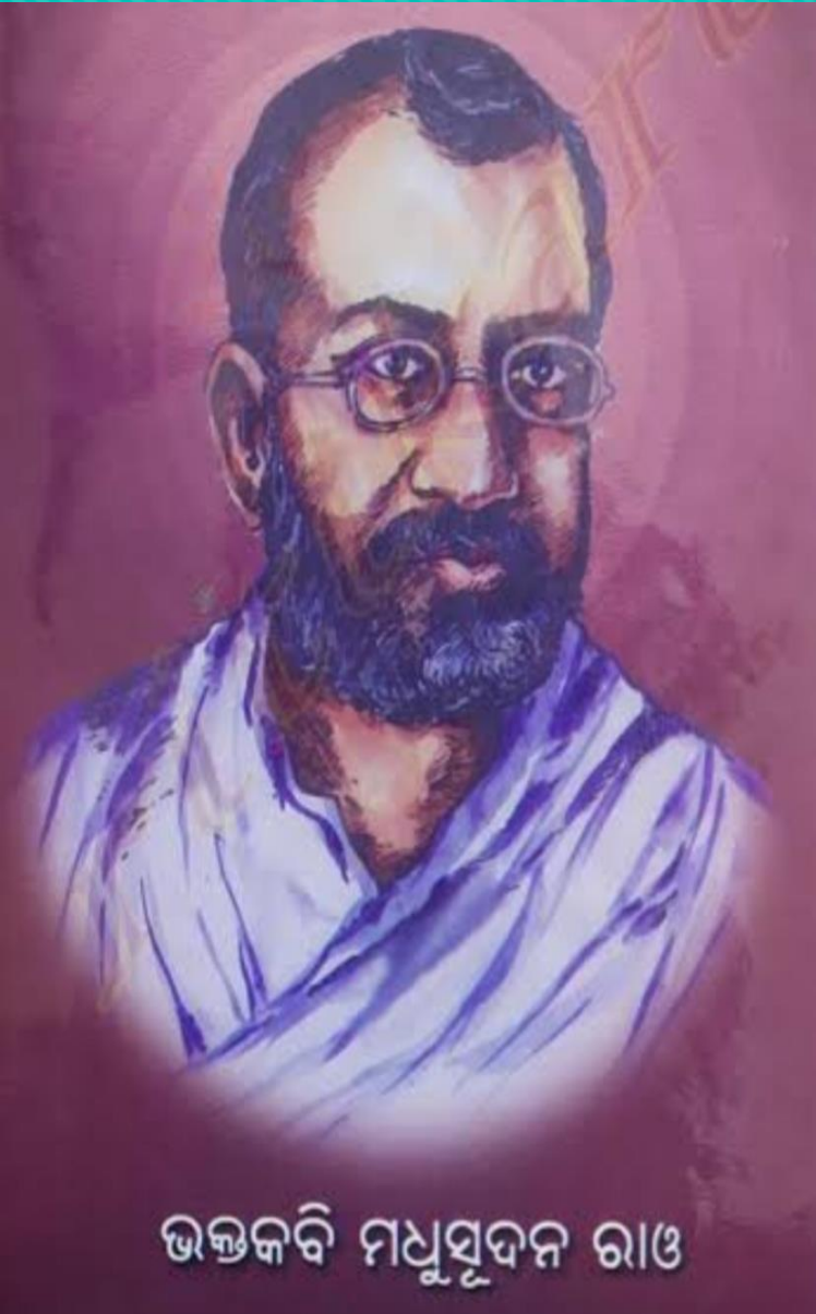
ଭକ୍ତକବି ମଧୁସୂଦନ ରାଓ