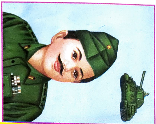
SOLDIER (ARMY) सैनिक (थल सेना)