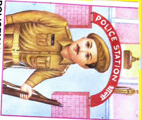
POLICEMAN (CONSTABLE) पुलिस का सिपाही