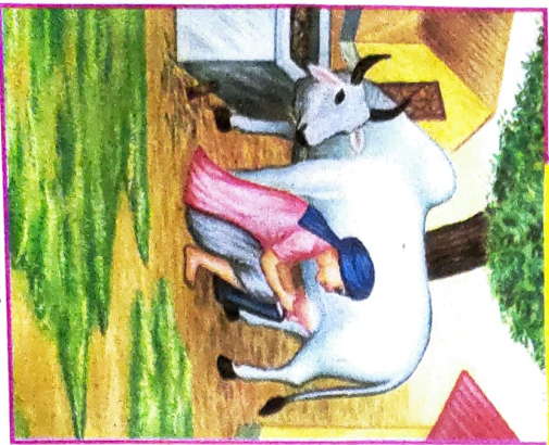
MILKMAN गाला (दूध वाला)