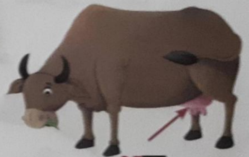
थन (than) Dug

थ थ थ थ थ थ थ थ थ थ थ थ थ थ थ थ थ थ थ थ थ थ थ थ