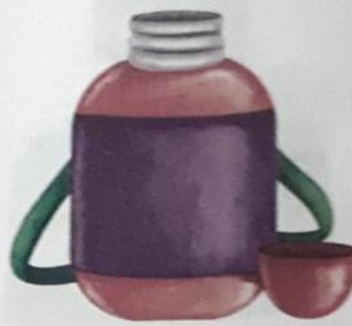
थरमस (tharmas) Flask