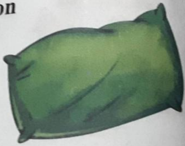
तकिया (takia) Pillow