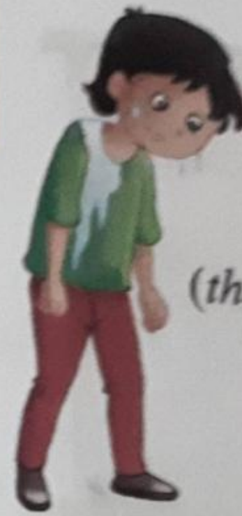
थकान (thakaan) Tiredness