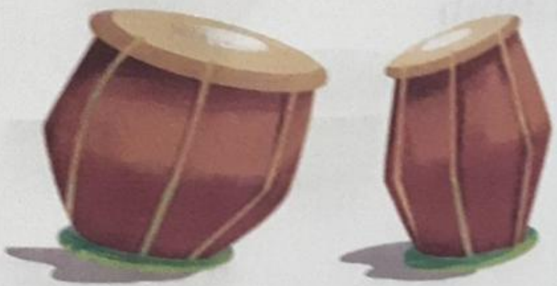
तबला (tabla) Tabla