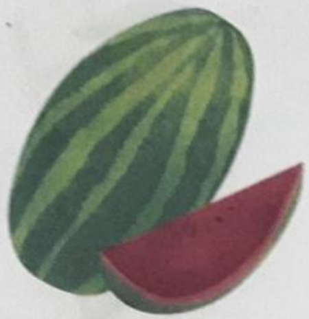
तरबूज (tarbooz) Watermelon