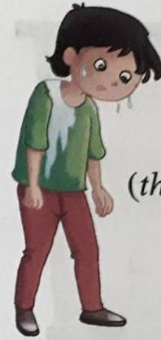
थकान (thakaan) Tiredness