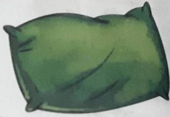
तकिया (takia) Pillow

त त त त त त त त त त त त त त त त त त त त त त त त