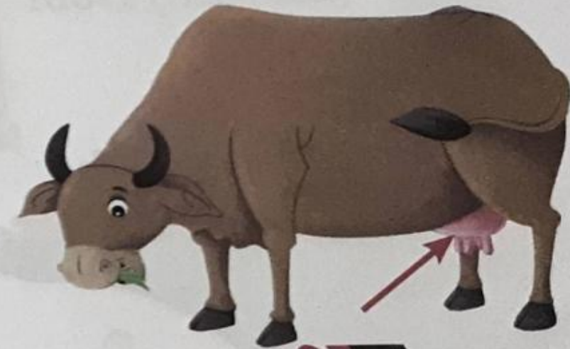
थन (than) Dug

थ थ थ थ थ थ थ थ थ थ थ थ थ थ थ थ थ थ थ थ थ थ थ थ