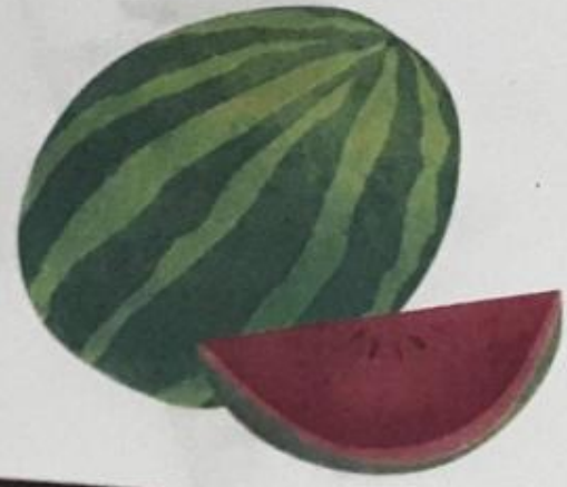
तरबूज़ (tarbooz) Watermelon