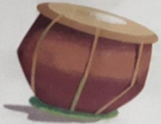
तबला (tabla) Tabla