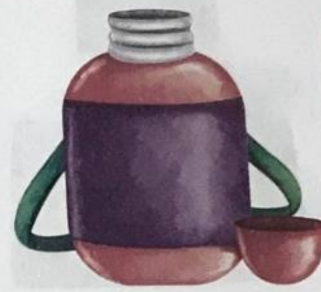
थरमस (tharmas) Flask